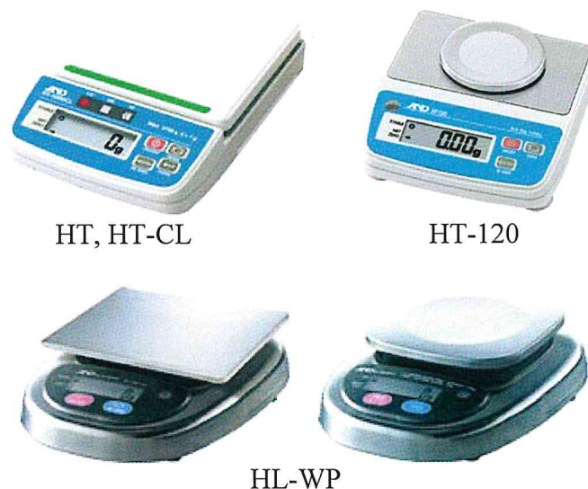
Рисунок 1 – Общий вид весов

Общий вид весов представлен на рисунке 1.