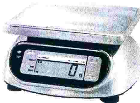
Рисунок 1 - Общий вид весов SK-WP

Общий вид весов представлен на рисунке 1.