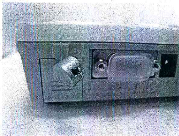
Рисунок 2 - Схема пломбировки от несанкционированного доступа

Схема пломбировки весов от несанкционированного доступа приведена на рисунке 2.