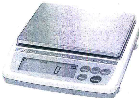
Рисунок 1 - Общий вид весов ЕК и ЕW

Общий вид весов представлен на рисунке 1.