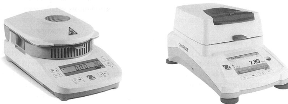
Рисунок 1 – Общий вид анализаторов

Общий вид анализаторов представлен на рисунке 1.