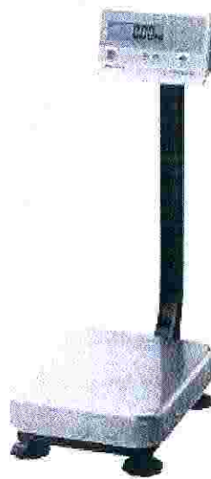
Рисунок 1 - Общий вид весов FG

Общий вид весов представлен на рисунке 1.